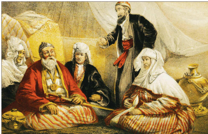
Томас Аткинсонның Орталық Азияға саяхаттары туралы кітаптарға арналған иллюстрациялар.

Ол Ұлы жүз бен Орта жүз ауылдарына шабуыл ұйымдастырып тұратын. Люси Аткинсон да оны өз жазбасының «Сұлтан сергелдеңі» бөлімінде өте жағымсыз кейіпкер ретінде сипаттайды [Первые английские путешественники в Казахской степи, 2006, 185-186].